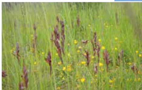
Sérapias à labelle allongé (Serapias vomeracea).

Superbe enclos en pierres sèches d'un ancien champ cultivé.