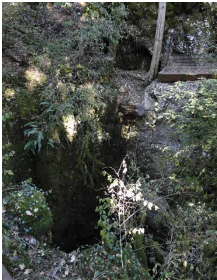
▼ Entrée de l'igue de Planagrèze

Du parking, franchissez le « passage canadien » et prenez la large piste. Admirez à droite le superbe enclos, ancienne parcelle cultivée, entièrement construit en pierre. Vous arrivez rapidement devant un curieux mur, constitué de très grosses pierres plates posées verticalement les unes contre les autres. Juste de l'autre côté, vous devinez la grande dépression de l'igue de Planagrèze. Approchez-vous de la barrière en métal, mais la vue est masquée par la végétation. Longez le mur vers la gauche, et tournez à droite au niveau du panneau des Espaces Naturels Sensibles du Lot consacré à la cavité. Un petit portail (bien le refermer) marque le début du petit sentier qui descend au bord du gouffre (barrières métalliques de sécurité) ①.