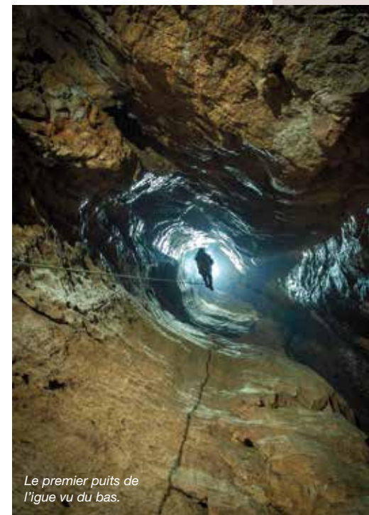
Le premier puits de l'igue vu du bas.

En patois quercynois, une igue désigne une cavité dont l'entrée est verticale, alors que le terme de gouffre est réservé aux exurgences noyées. Chaque région possède son appellation : aven en Provence, scialet dans le Vercors, chourum dans le Dévoluy, tanne en Savoie, etc. L'igue de Planagrèze est connue des bergers depuis toujours, mais c'est l'incontournable Edouard-Alfred Martel qui en a descendu la première verticale de 70 m, en 1889, avant d'être bloqué par un bouchon d'éboulis. La suite fût découverte plus tard en élargissant un conduit parallèle, ce qui a permis de découvrir, vers 110 m de profondeur, une étonnante « rivière suspendue ». Comme plusieurs igues de la Braunhie (prononcez brogne), Planagrèze se termine sur un plan d'eau, qui a été plongé jusqu'à plus de 80 m de verticale sous l'eau.