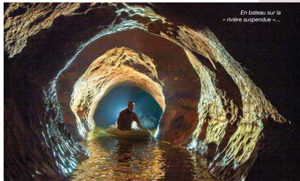
En bateau sur la « rivière suspendue »...