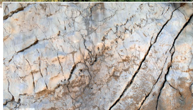
Des joints stylolithiques dans le calcaire tithonien.