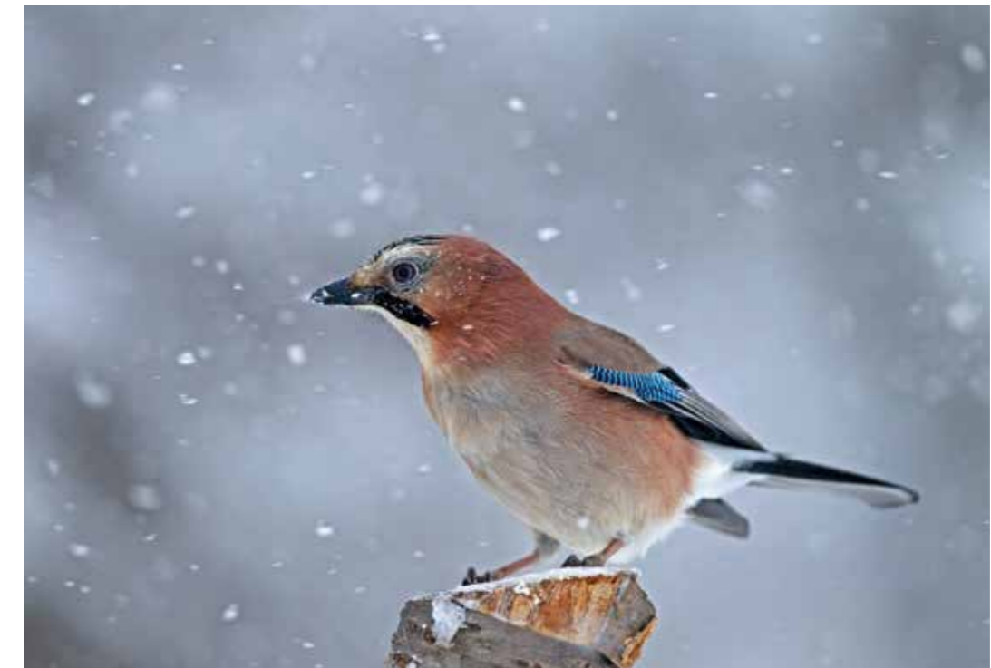
Geai des chênes sous une pluie de neige.

L'hiver, dans le massif du Jura franco-suisse, est un véritable enchantement pour la pupille. Les paysages revêtent une somptueuse fourrure de saison dont le blanc est de rigueur. La neige masque les stigmates des agressions portées à la nature. Tout n'est plus que magie et féerie. Le paradis blanc éclipse une réalité beaucoup moins poétique et bucolique pour la faune sauvage. La neige, la glace et le froid représentent un cocktail potentiellement mortel pour les animaux, qu'ils soient à poils ou à plumes.