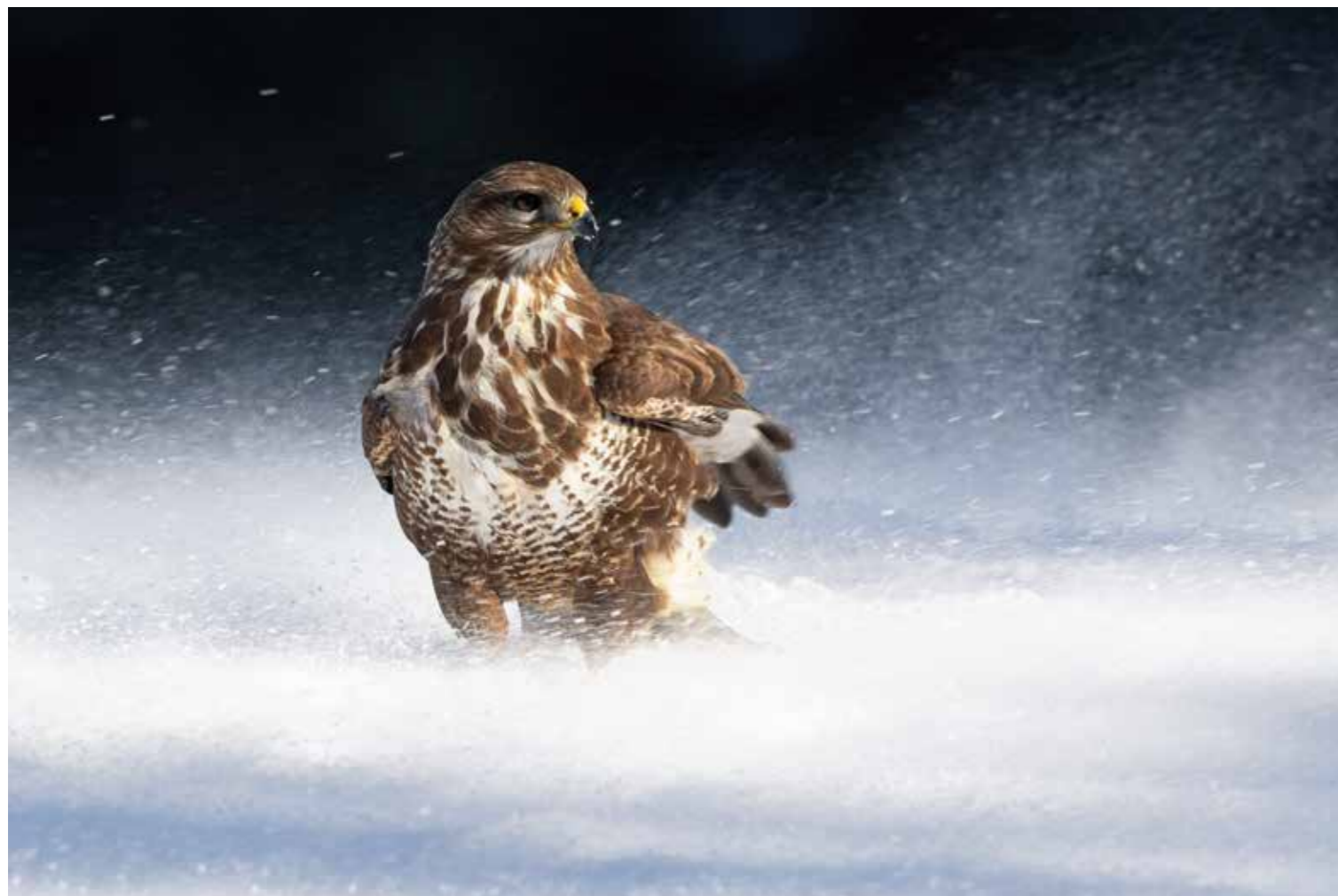
Buse variable giflée par un coup de vent aussi violent que soudain.

→ Festin royal et providentiel pour ce même rapace consommant un chevreuil mort d'épuisement.