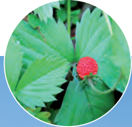
Fraisier des bois ( Fragaria vesca ).

Depuis l'ancien camp du Struthof, vue vers la vallée de la Bruche et les carrières dans le sédimentaire du Dévonien.